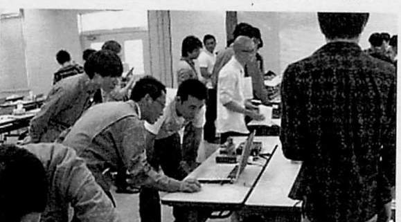
東京測器研究所様のひずみ測定実習