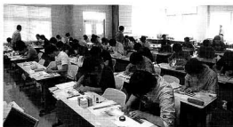
ひずみ測定講習会の様子