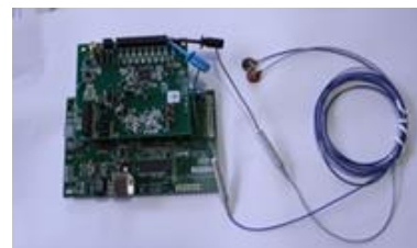
図3 プロトタイプ伝送系装置部分（EEGセンサプローブ装着）