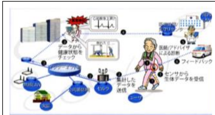
図1 開発するシナプスインフォマティクス研究支援と将来システムの関連イメージ

2. 研究目的 脳科学におけるニューラル信号とシナプス信号の関連究明を通して（自閉症やアスペルガー症候群に類する）重度な精神障害を治療・回復する方法を確立する。また、シナプス信号の発現構造究明から得られると予想される新たなBrain Machine Interface(BMI)の開発を支援する。本研究では、新たな手法として、自由環境下における動物の活動から得られる（測定時にお拘束ストレスの少ない）ニューロ信号、シナプス信号を得るための信号取得機器の開発を目的とする。（図1）