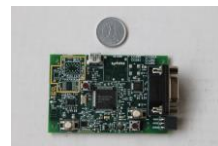
図5 開発した試作回路