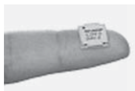
図2 ワンセグ受信用チューナモジュール

2006年4月から開始された携帯機器向けのデジタルテレビ放送（ワンセグ）の受信には、このような大きな受信モジュールは採用できないため、コイルやコンデンサを使わない集積化に適した新しい回路アーキテクチャを開発し、図2にあるような小さなモジュールを開発することができました。この開発の過程は講義の中で紹介したいと思います。