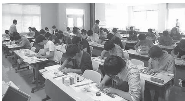
ひずみ測定講習会の様子