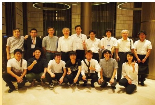
ベトナム・ホーチミン市開催の 集積回路国際会議で 研究室から多数参加・発表

研究成果を世界に発信 大学院生の海外国際学会での多数の発表 世界からの留学生・研究者の受け入れ