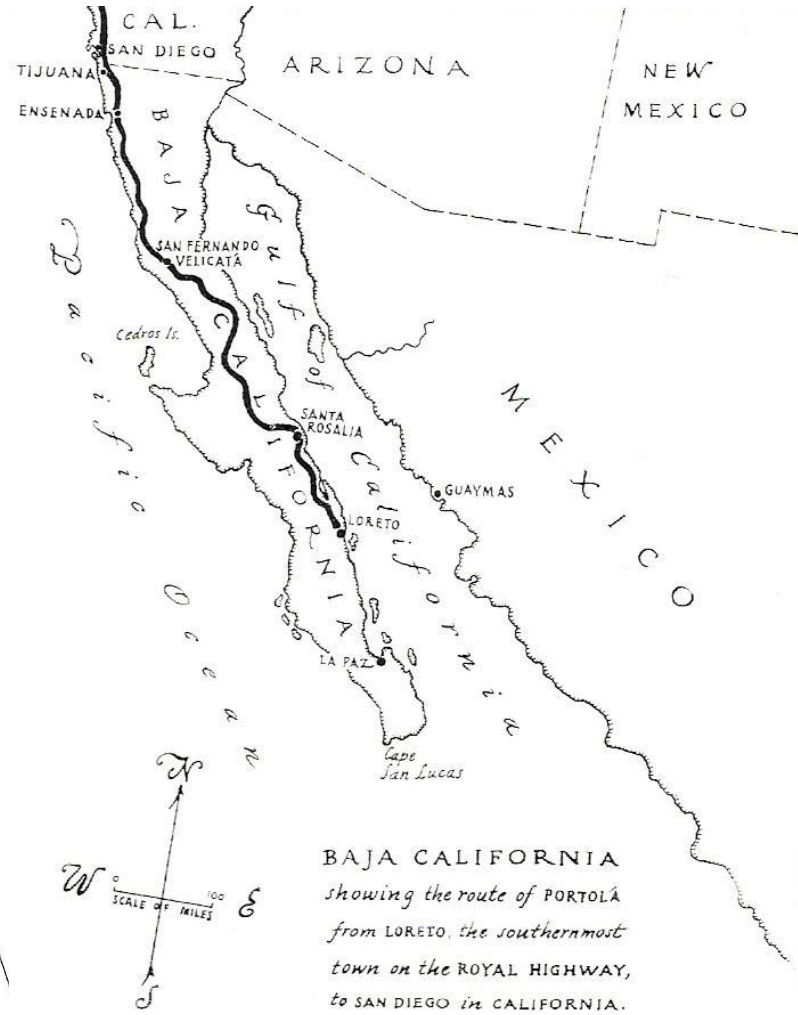
BAJA CALIFORNIA showing the route of PORTOLÁ from LORETO, the southernmost town on the ROYAL HIGHWAY, to SAN DIEGO in CALIFORNIA.