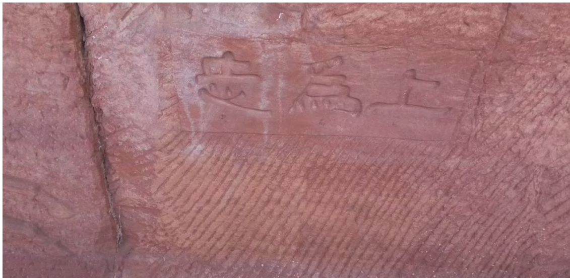
㉑ 佞痴不癡 痴を佞るも癡せず