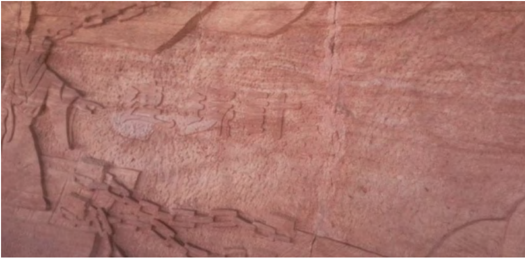
⑳ 上屋抽梯 屋に上げて梯を抽す