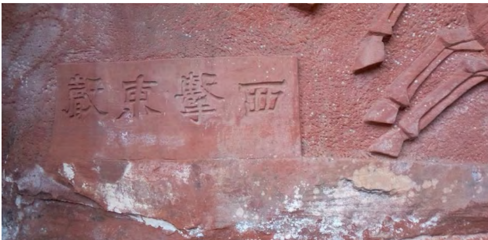
⑦ 抛磚引玉 磚を抛げて玉を引く