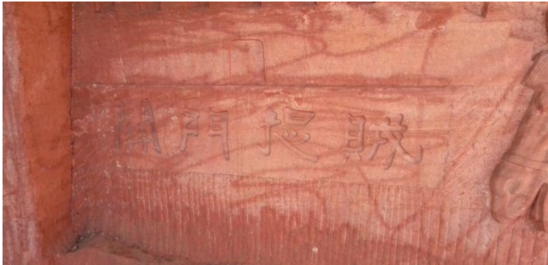
㉑ 欲擒姑縦 擒えんと欲すれば姑く縦て