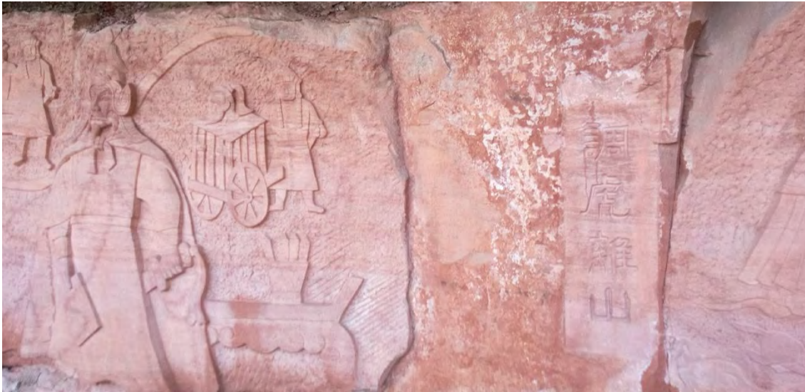
③ 反間計 反間の計