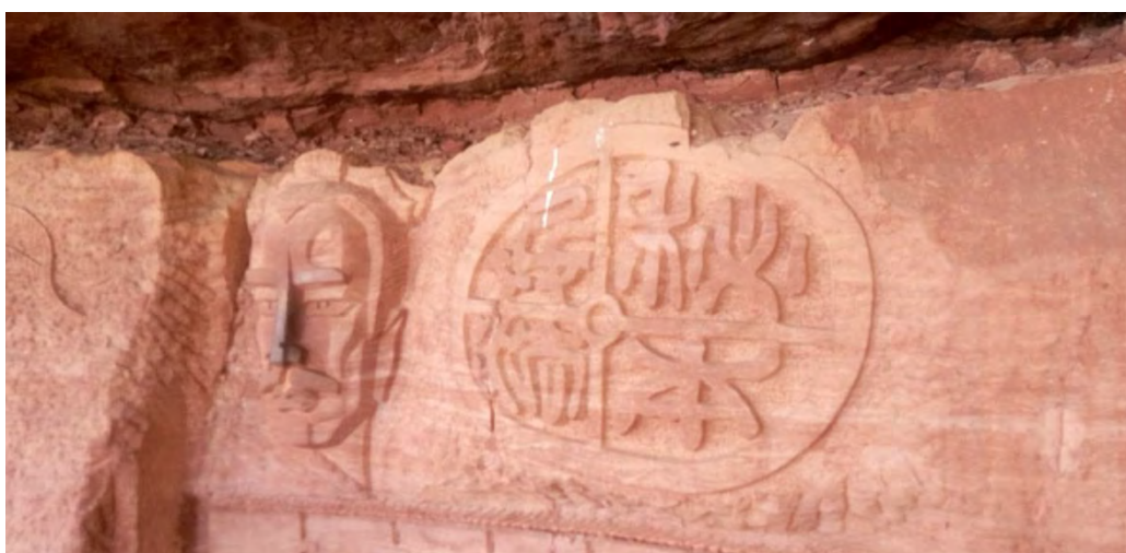
③⑤ 連環計 連環の計