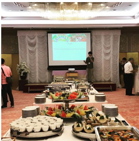
宴会が始まります (ホテル千姫物語)

19日の夜、ホテル千姫物語で交流パーティーに参加しました。みんなでお酒を飲みながら話をしました。夕食が終わると、「朋友」の歌と一緒に歌いました。とても楽しかったです。