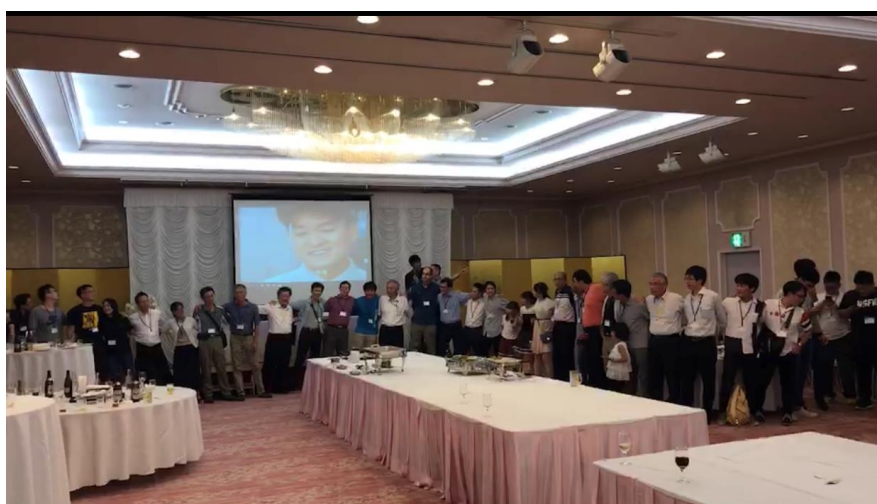
みんなで「朋友」を合唱する