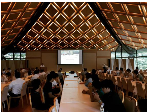
キーノート、ポスター発表場所