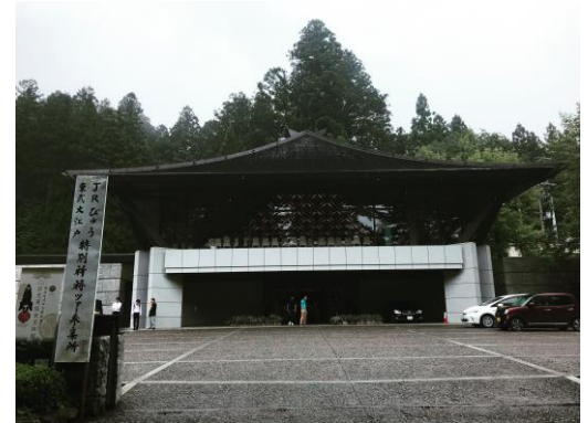
キーノート、ポスター発表会場 （日光東照宮「客殿」）

国際的な交流学会に参加するのは初めてです。今回の機会に電子電気業界の先生たちと交流することができてとても嬉しいです。今回私が発表したポスターのテーマは「Current Balancing Circuit for Multiphase Half/Full Wave Resonant Converter」です。発表の時は緊張しましたが、これからも多くの収穫があります。