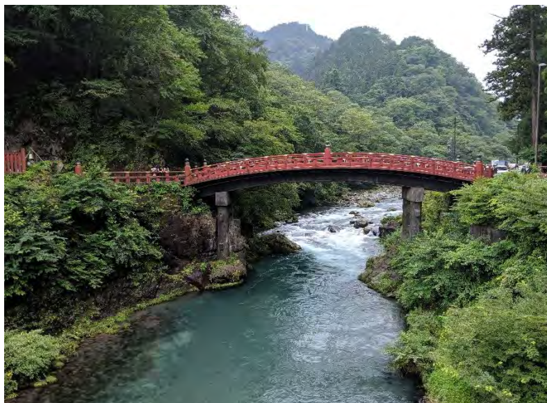
周辺を流れる大谷川（とてもきれい）