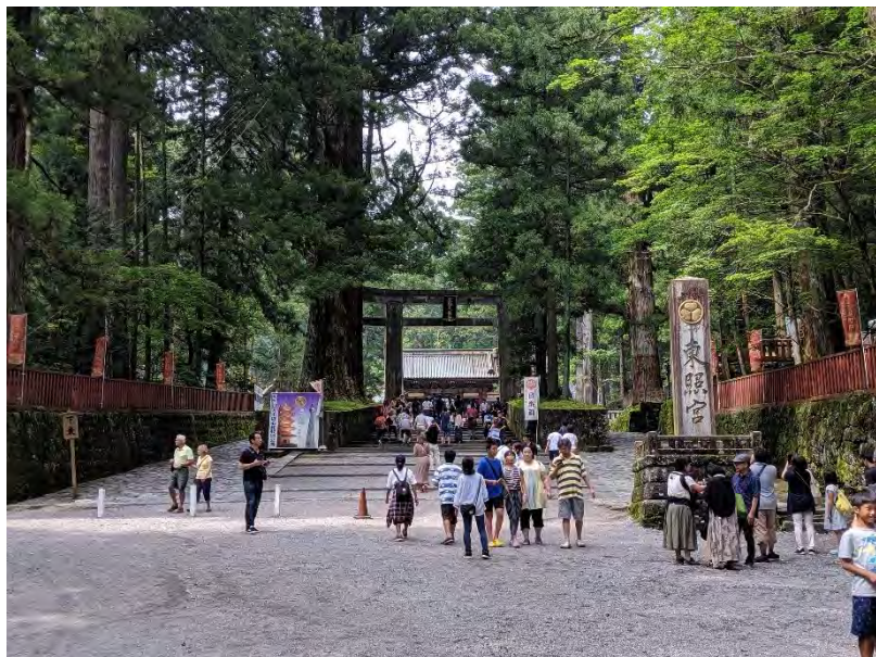
東照宮へつながる参道（観光客が多い）

学会の休憩時間などを利用して東照宮周辺を観光した。日光は世界的にも有名な観光地であり、周辺を観光していてもたくさんの外国人観光客の姿を見た。今回発表を行った輪王寺、日光東照宮はどちらもユネスコの世界遺産に登録されており、夏休み中ということもあってかたくさんの人で賑わっていた。