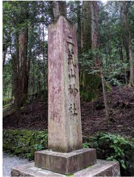
二荒山神社の社号標