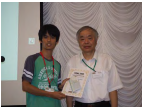
図6. soldering tournament受賞の様子