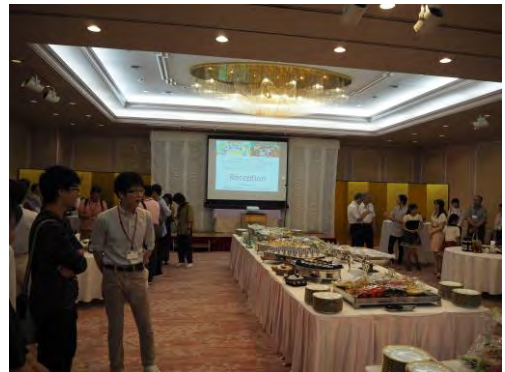
図5. レセプション会場 (千姫物語)