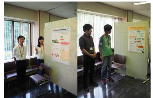
図3. WICAS/YP EVENTの様子