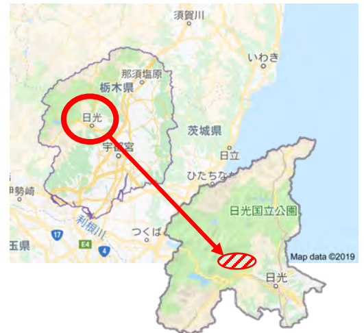
図1. 開催地：群馬県日光市山内日光東照宮

1件は「soldering tournament」と題してはんだ付けのスピード正確さを競うイベントであり、もう1件は「Local Fruit Picking」と題して今回のような3日間かけて行われる学会をターゲットとして事前に交流を深めるといったものである。私は「Local Fruit Picking」のほうを担当し発表・質疑応答を行った。発表に興味を持っていただいたかたにFood CASというものを教えていただいた。Food CASは、スーパーマーケット・食品小売業の方々が、自ら添加物を配合しない食品の製造販売時に必要なラベル表示を、新食品表示法に順守した、生活者にも認識しやすい形式で表示を作成するシステムのことである。