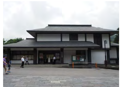
図2. 1日目開催地 輪王寺前