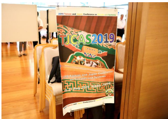
学会ポスター (作成：高橋洋平)