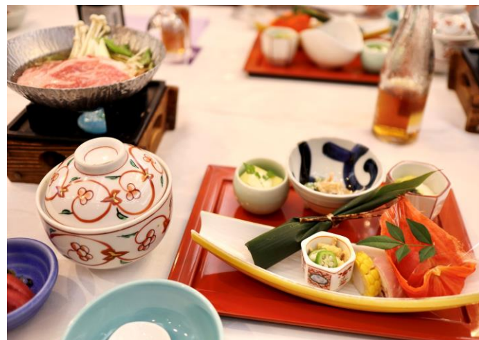
2日目夜のホテル千姫物語でのパンケットの食事