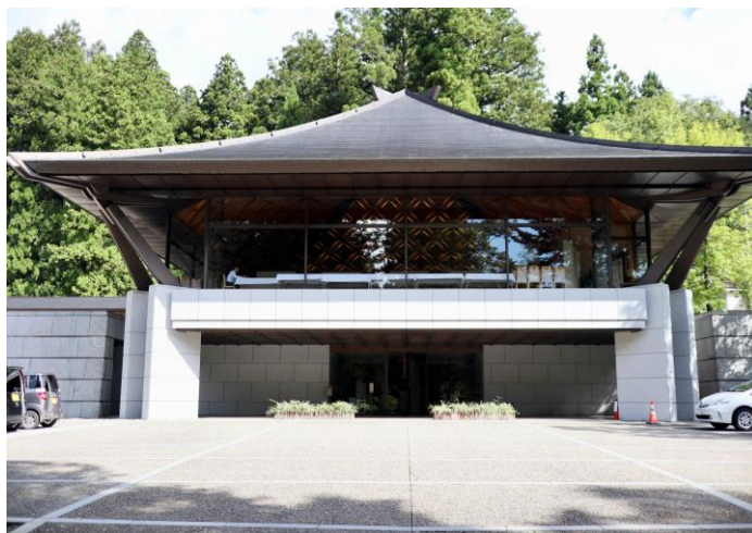
2,3日目の会場：日光東照宮「客殿」