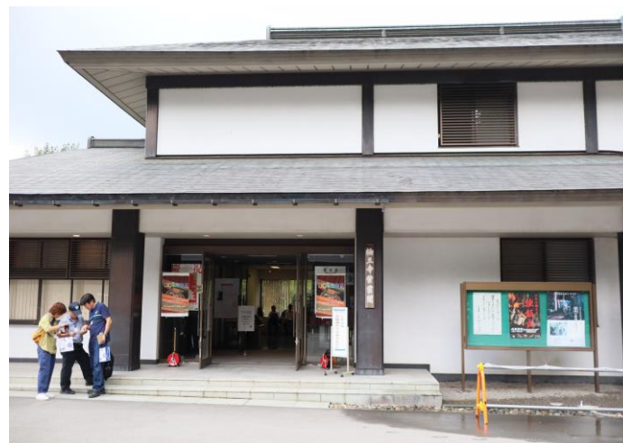
1日目の会場：輪王寺「紫雲閣」