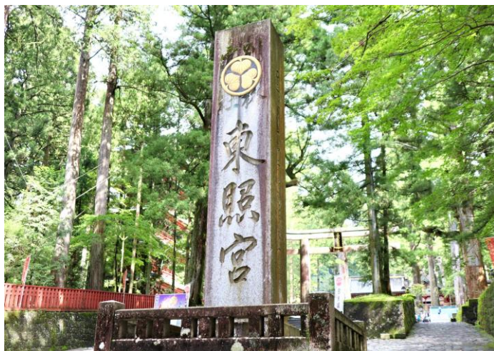
開催地である「日光の社寺」エリアの様子

以上、本学会への参加は、自身にとって非常に良い経験・勉強になりました。皆さま、ありがとうございました。