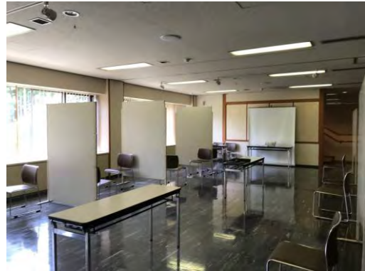
日光山輪王寺 紫雲閣(WiCAS/YP 会場)

「電子回路はんだ付け競争イベント」や「様々な国の人々との料理会」など、斬新で興味深いアイデアが提案されていた。