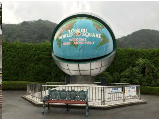
東武ワールドスクウェア(栃木県日光市鬼怒川温泉大原)