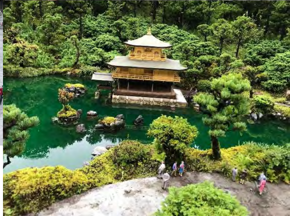
世界の建造物や世界遺産 が再現されている