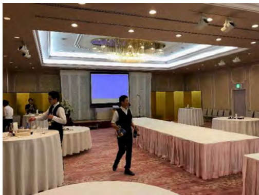
ホテル千姫物語(Reception 会場)

夜に行われた Reception(於 ホテル千姫物語)では、立食形式で TJCAS 参加者同士の交流が行われた。牛肉の赤ワイン煮、豚肉のしゃぶしゃぶが美味しかった。