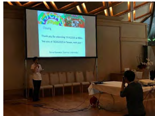
日光東照宮 客殿(TJCAS2019 閉会式)

日光東照宮 客殿にて、私は自身の研究内容について研究室の同期の学生と共同でポスター発表を行った。ポスター発表にお立ち寄り頂いた企業の方や学生の方からのご見解・ご意見をいただき、今後の研究の方針について考える材料を得ることができた。