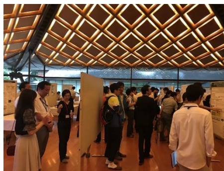
図 2 会場写真