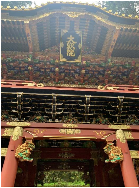
写真5 輪王寺大猷院