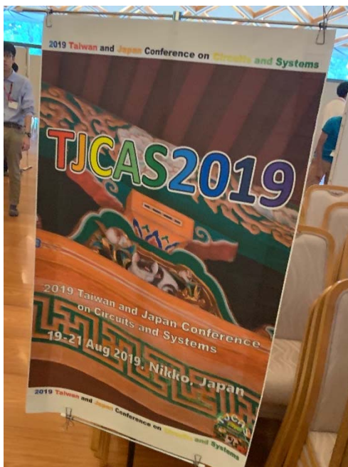
写真1 東照宮客殿の発表会場