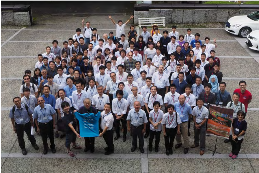
写真 5 TJCAS2019 集合写真