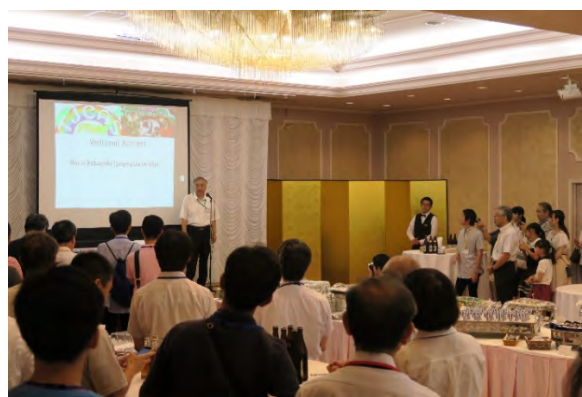
写真1, 2 Welcome Reception 会場の様子