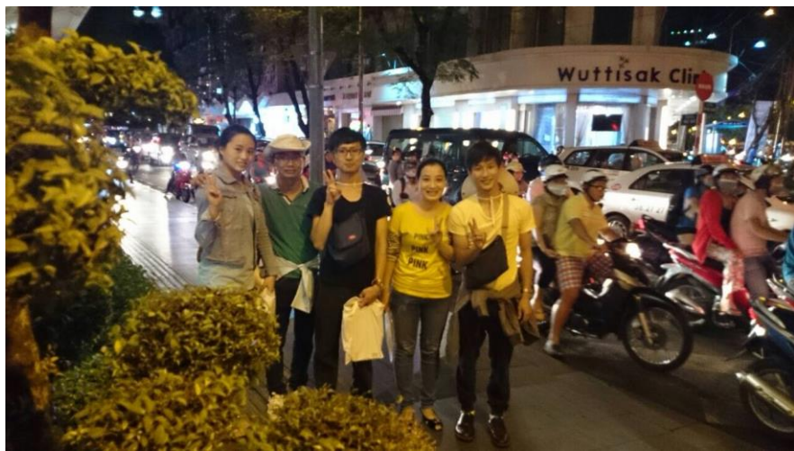
最後にベトナムの学会参加されていた方と記念写真