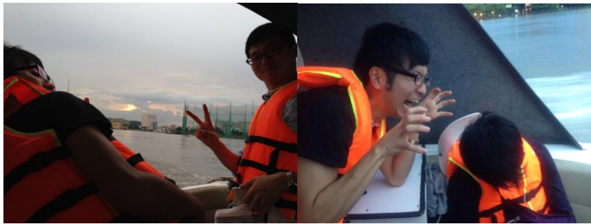
サイゴン川を遊覧