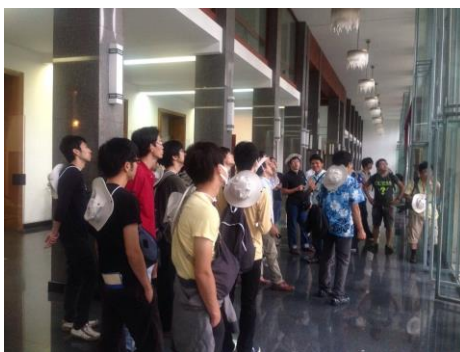
なにやら観光スポットらしき記念館