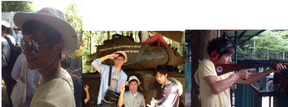
クチトンネル観光