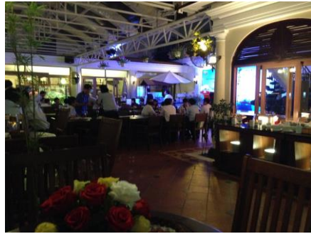
22日(水) カンファレンス オープニングセレモニー英語って難しいです...