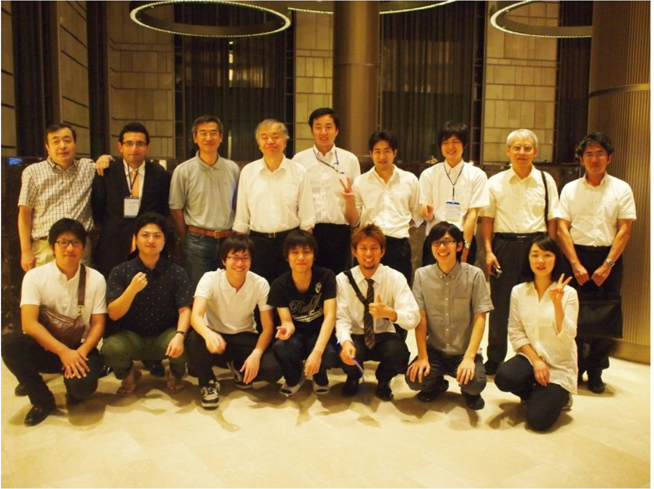
ニッコーホテルにて