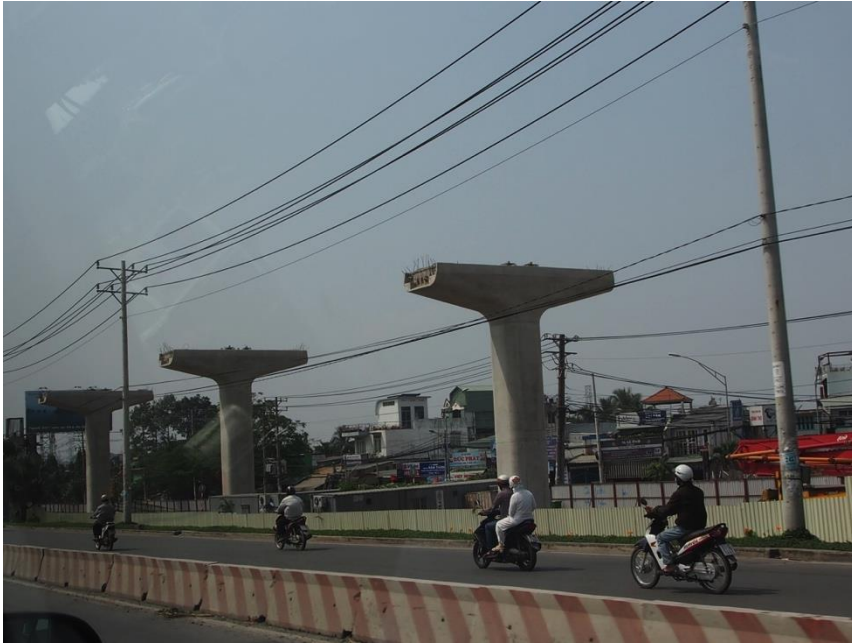
高速道路脇を地下鉄の橋梁が並ぶ

・今回、驚いたのはホーチミン市郊外にある大学に行く幹線道路がまた一段と良くなったことである。この道路はインテルや日本電産の工場があるサイゴンハイテクパーク（SHTP）にも通じる道路で、昔、大型トレーラーが延々と渋滞していた狭い道が片側3~4車線の広い高速道路になっていた。この道路に並行して建設中の地下鉄高架橋工事もすすんでいた。