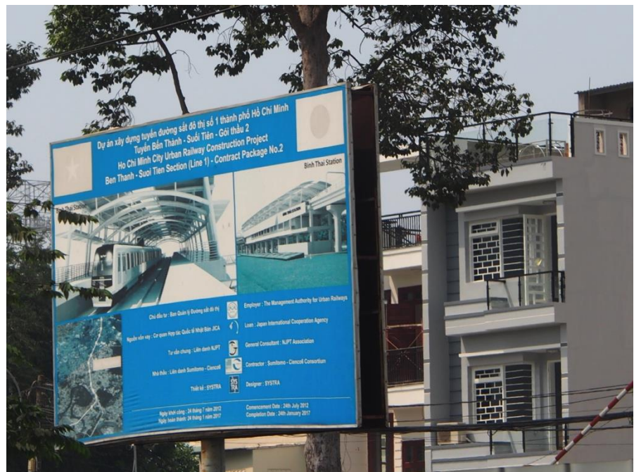
地下鉄 Binh Thai 駅建設予定地