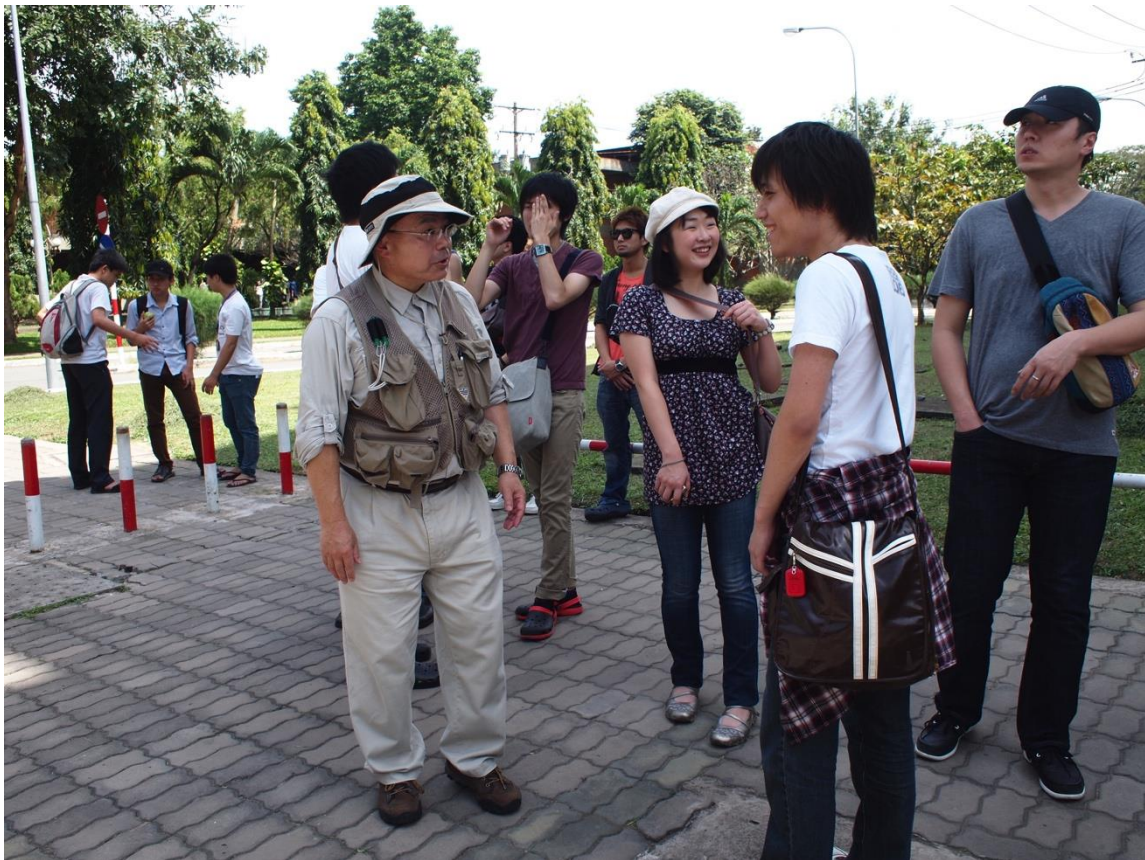
校内散策風景 その 2