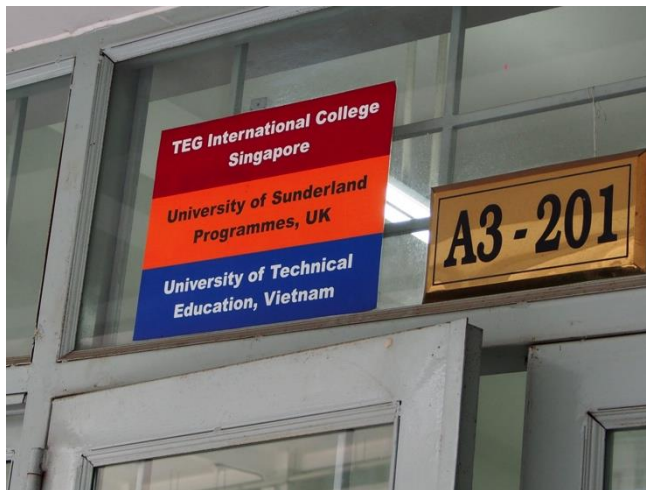
英語講義専用教室。日本語講義教室も同様に整備予定。