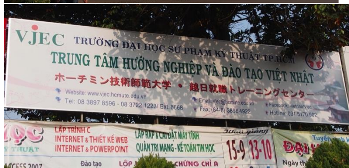
ホーチミン技術師範大学メインビルと正門付近