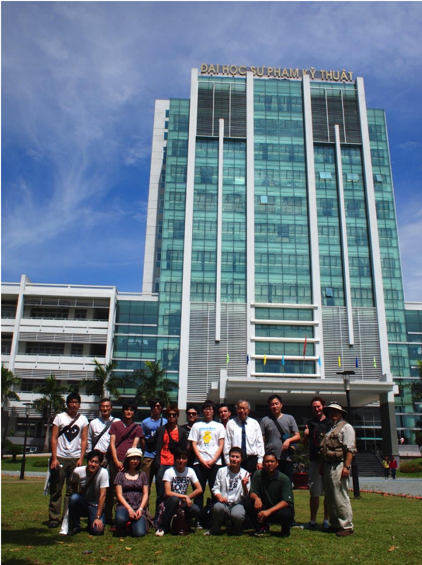
正面メインビルの前で