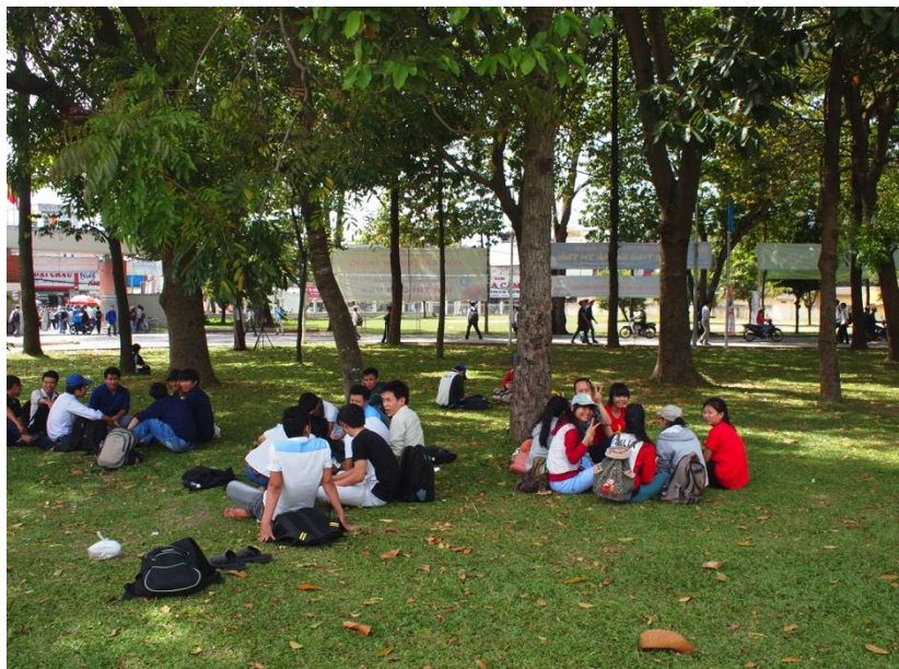
学生たちが集まる正門わきの木陰