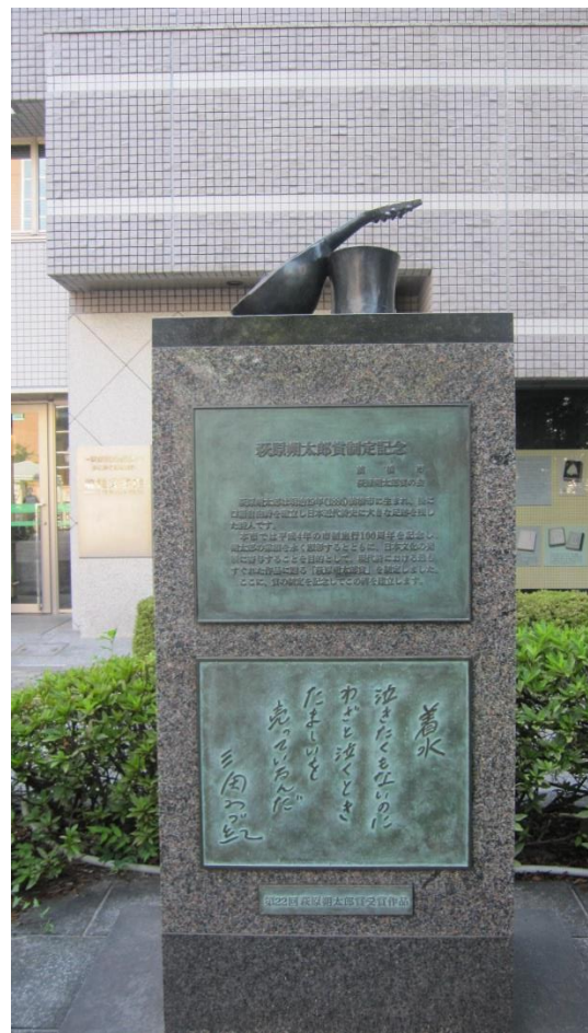
朔太郎の音楽・楽器好き、