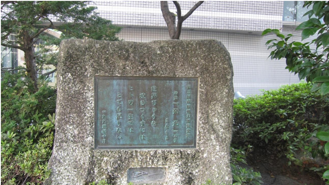
水と緑と詩のまち 前橋