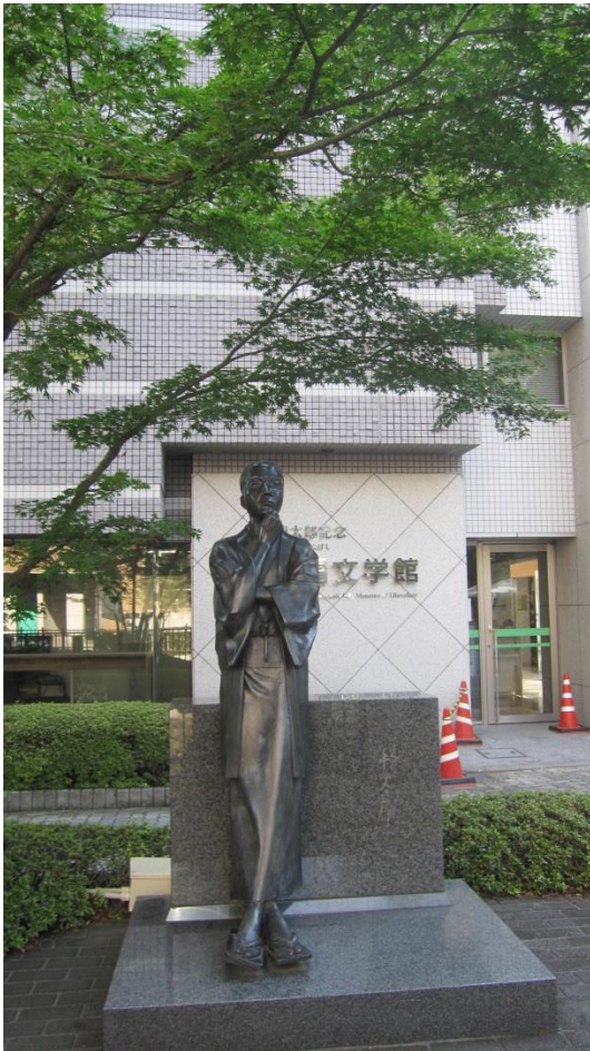
萩原朔太郎 明治19年—昭和17年