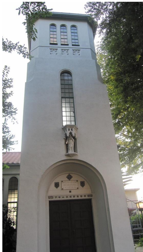
前橋にキリスト教の教会多し