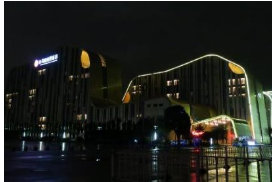
学会会場のホテル（昼と夜）