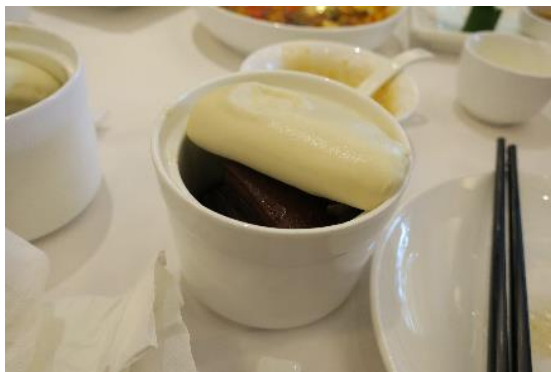
杭州の名物料理「东坡肉(トンポーロウ)」