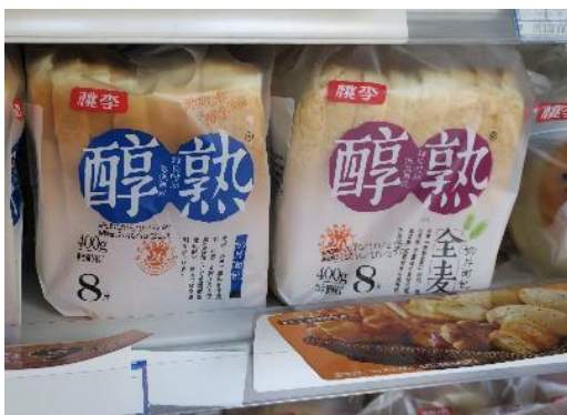
中国の食パン (中国大手パンメーカー「桃李」の商品)