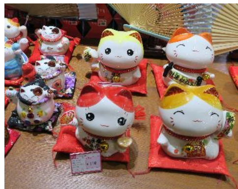
何かを訴えている猫