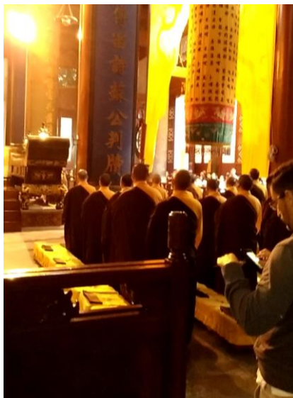
お経を唱えるお坊さん