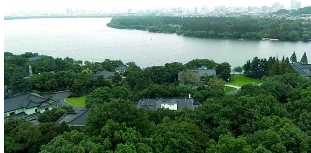
雷峰塔からの景色