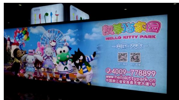
パチもん臭がする看板