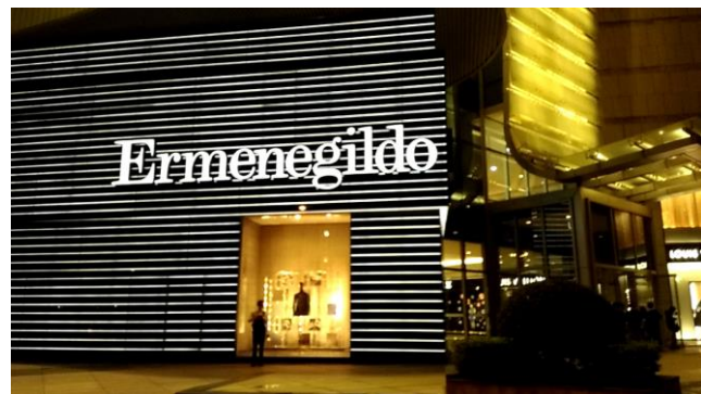
杭州随一の百貨店