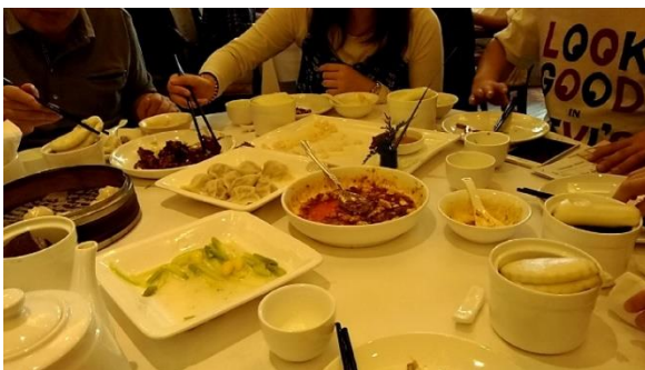
足パンパン状態で食べた昼食