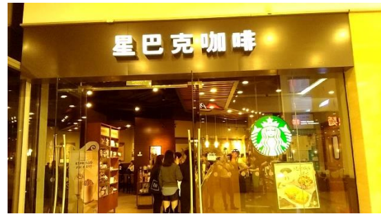
星(スター)巴克(ボックス)コーヒー