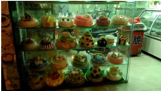
街中いたるところにあるケーキ屋さん