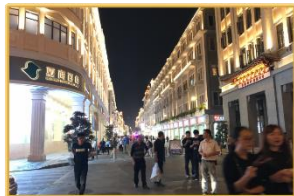
▲眠らない町アモイ