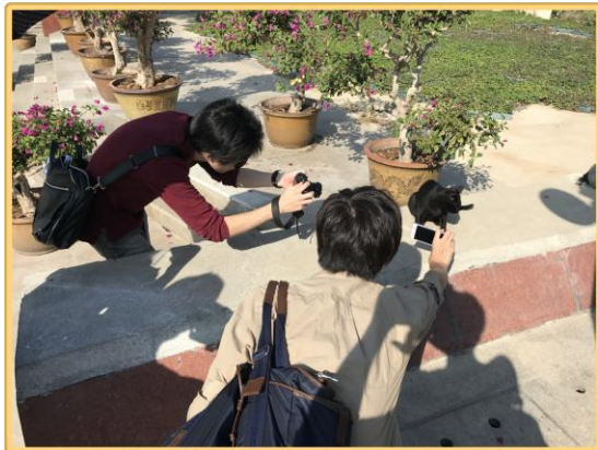
▲ねこに群がるものたち