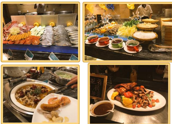
▲ホテルのバイキング