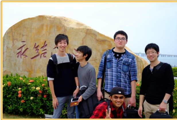
▲永遠に結ばれる...らしい