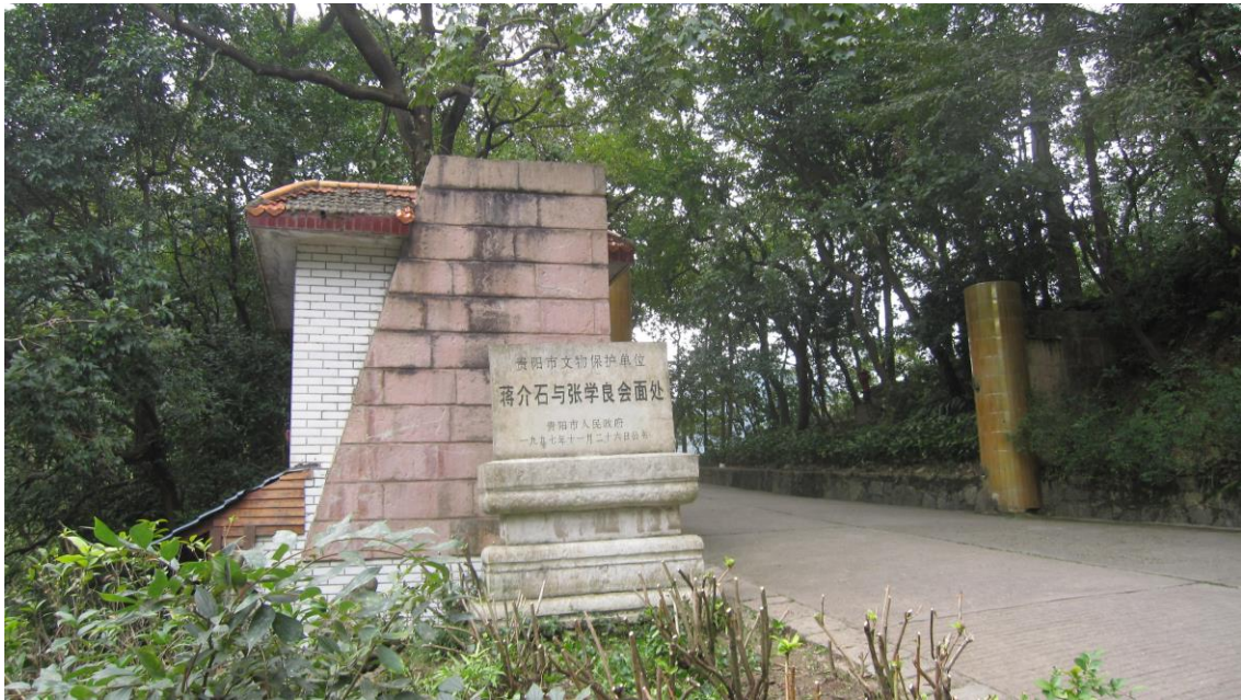
蒋介石、張学良 会談の地