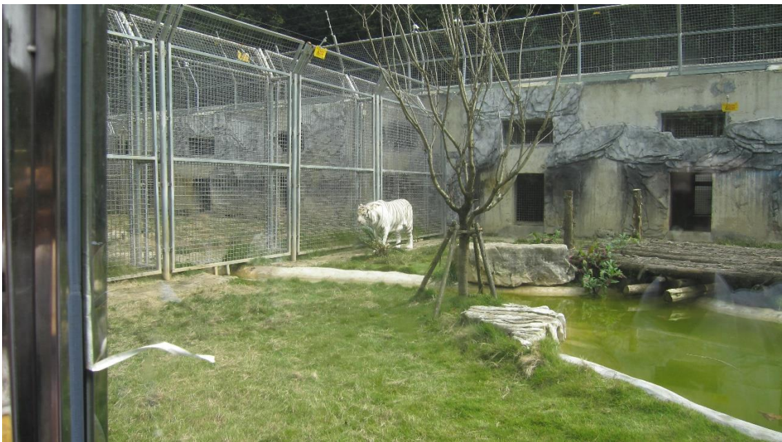
白虎を初めて見る