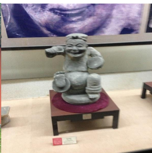
昔の笑い芸人の彫刻