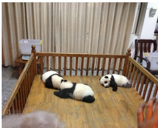
成都大熊猫繁育研究基地