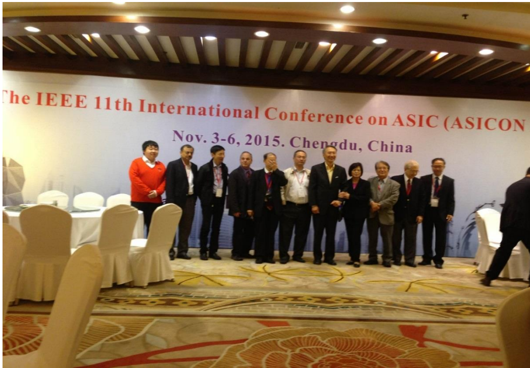
最終日の Banquet での学会委員の方々の集合写真