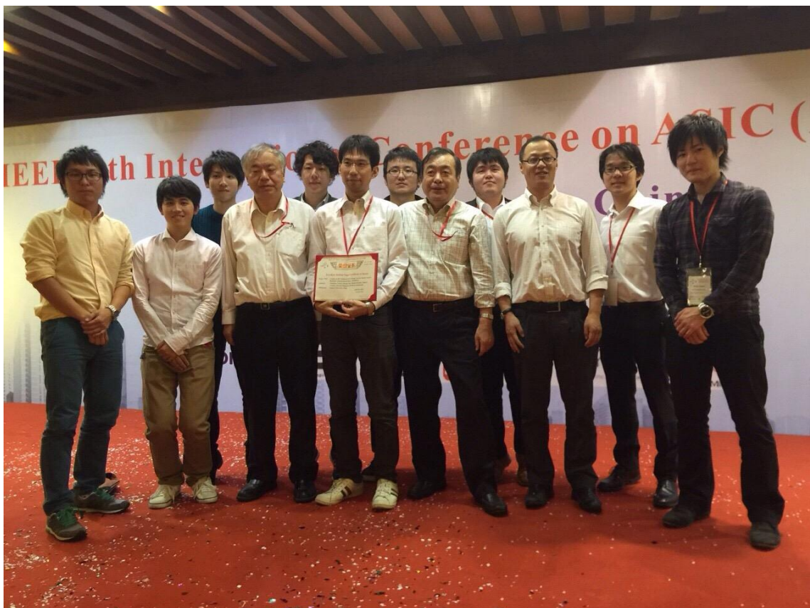
最終日の Banquet での研究室メンバーでの集合写真