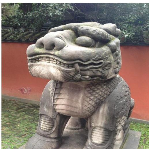
成都武侯祠の石獅子(顔が面白い)